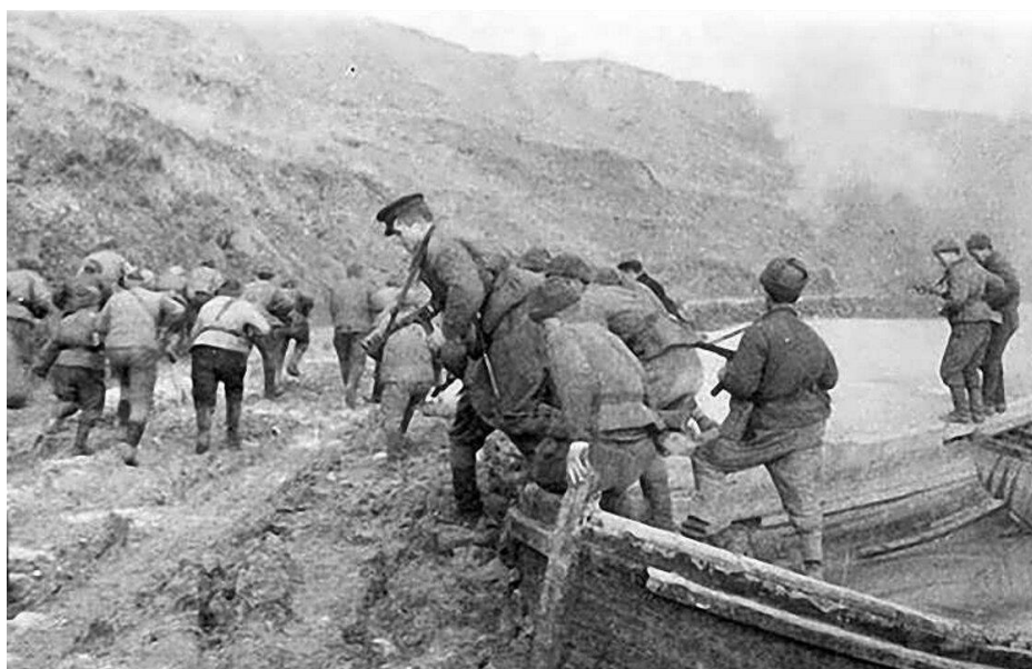
Фото. Высадка десанта в ходе Керченско-Эльтигенской операции

В ноябре 1943 года нога советского солдата вновь ступила на крымскую землю. В ходе Керченско-Эльтигенской операции частям 56-й армии удалось отбить небольшой плацдарм в районе города Керчь. Буквально год назад здесь, в Аджимушкайских каменоломнях, долгие шесть месяцев держали оборону последние защитники Крыма. Оборона Аджимушкайских каменоломен стала одним из символов стойкости и силы духа советских воинов.