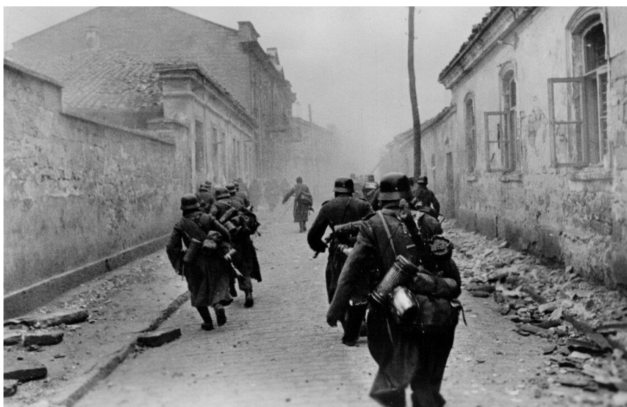
Фото. Немецкие солдаты в Крыму

Некоторое время защитникам удавалось контролировать район вокруг каменоломен, но частям вермахта удалось занять эти участки, вынудив всех красноармейцев уйти под землю. Немцы пытались преследовать их, но в каменоломнях встречали жесткий отпор и несли большие потери. Поэтому было решено изменить тактику: колодцы на поверхности, из которых защитники брали воду, были уничтожены, а в катакомбы 25 мая 1942 года пущен отравляющий газ. В тот день многие погибли, поскольку у бойцов в подземелье не хватало противогазов. Оставшиеся в живых приступили к сооружению газозубежищ, в которых переживали последующие химические атаки.